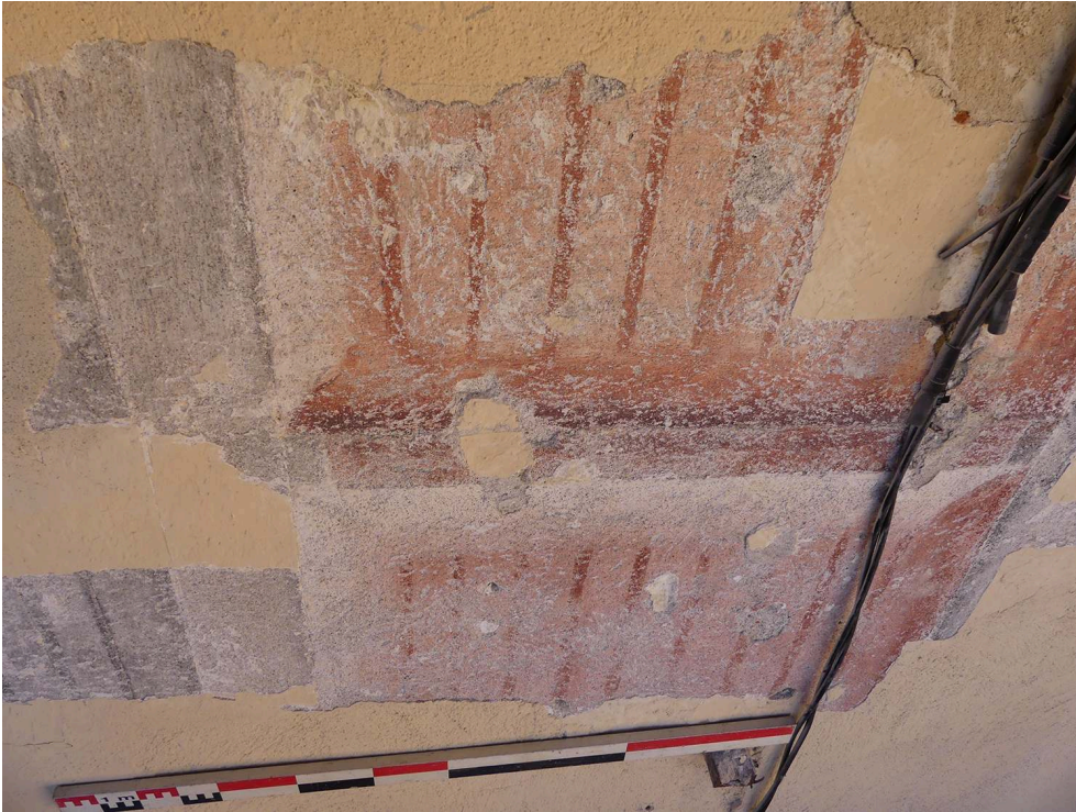
Fig. 2 – Vue du décor peint retrouvé sous l'enduit actuel