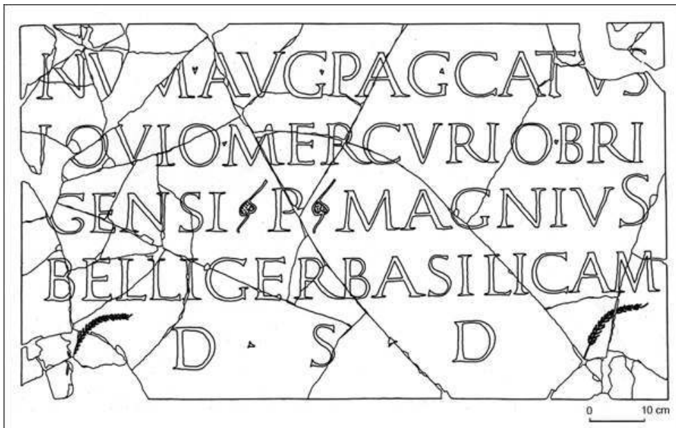
Fig. n°2 : Restitution de la plaque dédicatoire de la basilique

Auteur(s) : Mantel, Étienne.