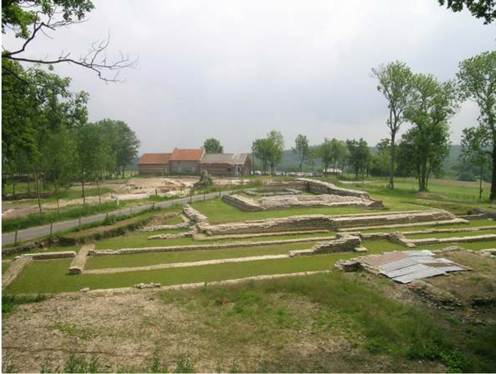
Fig. n°1 : Centre monumental en l'état actuel des recherches

Auteur(s) : Mantel, Étienne.