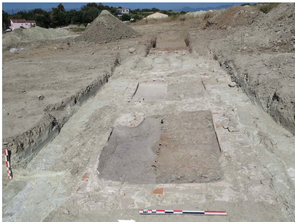
Fig. 3 – Bassins du Haut-Empire