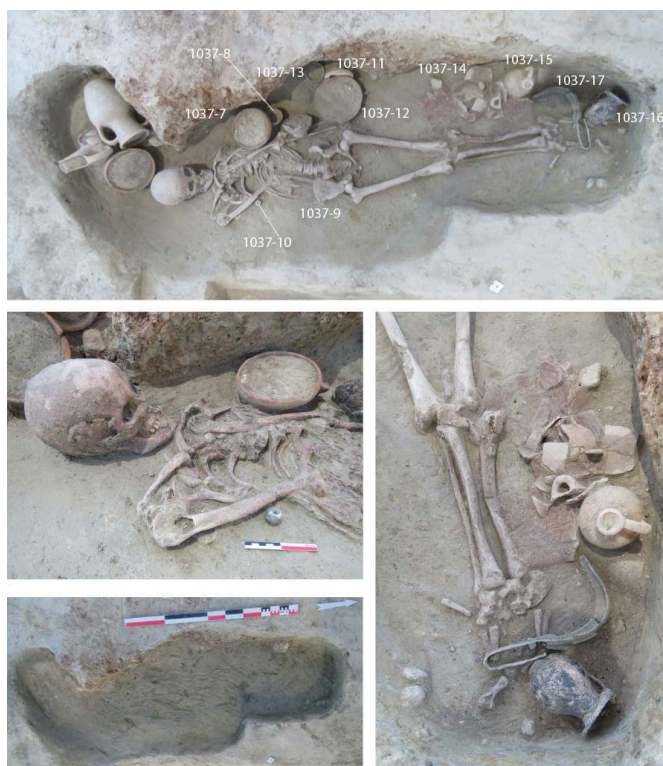
Fig. 2 – Tombe de la fin du IV e -début du III e s.