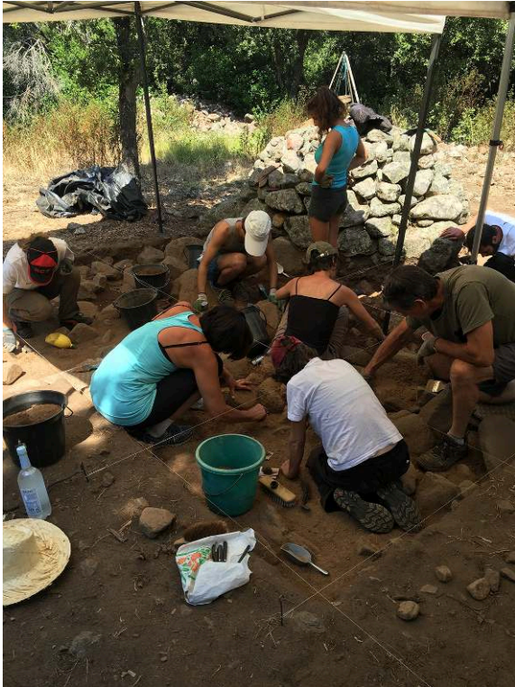
Fig. 2 – Fouille du secteur V