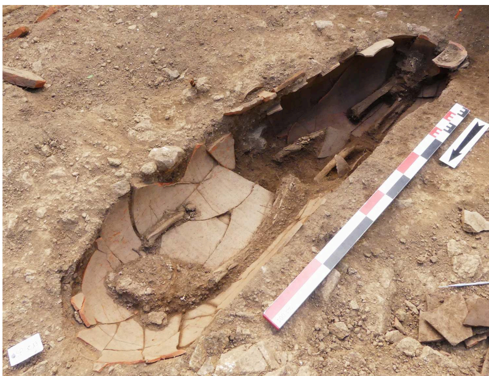
Fig. 2 – Sépulture en amphore SP1013 du sondage TR23