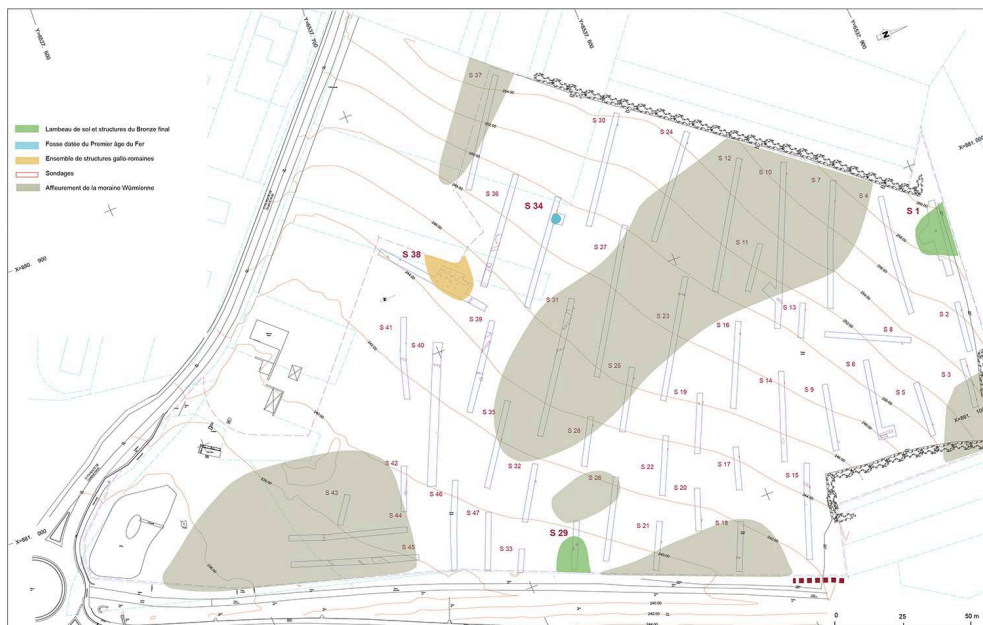
Fig. 3 – Localisation des zones de découvertes archéologiques datées de la protohistoire et de la période gallo-romaine