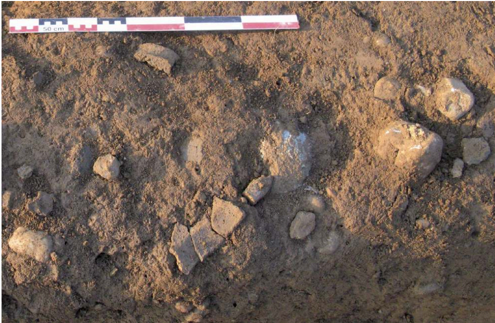
Fig. 1 – Détail des tessons de céramique du Bronze final dans le comblement de la cuvette F1