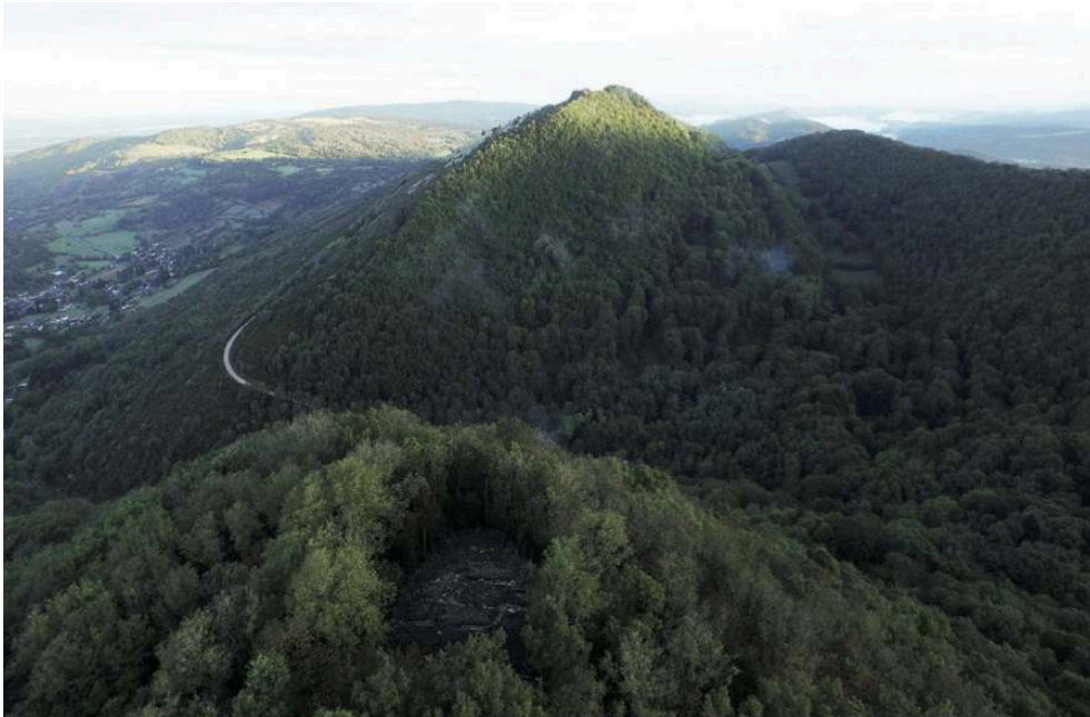
Fig. 1 – Vue aérienne