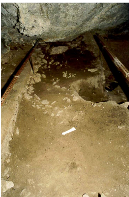
Au centre, l'ancien sondage.