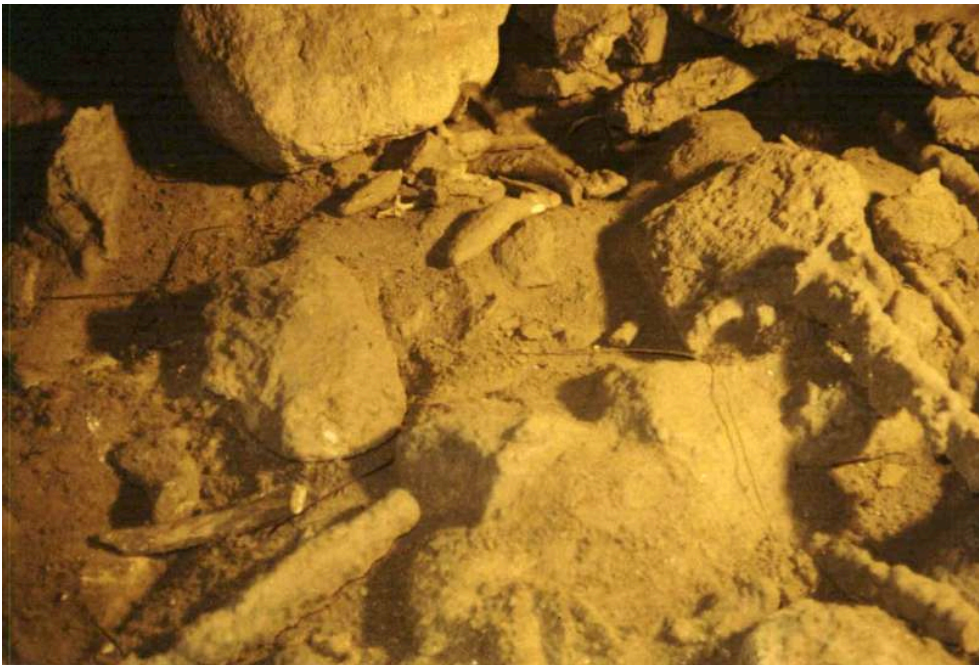
Fig. 2 – Aspect du sol lors de la découverte du réseau (blocs, sédiment, concrétions, canines et côtes d'ursidés, vertèbre de renard)