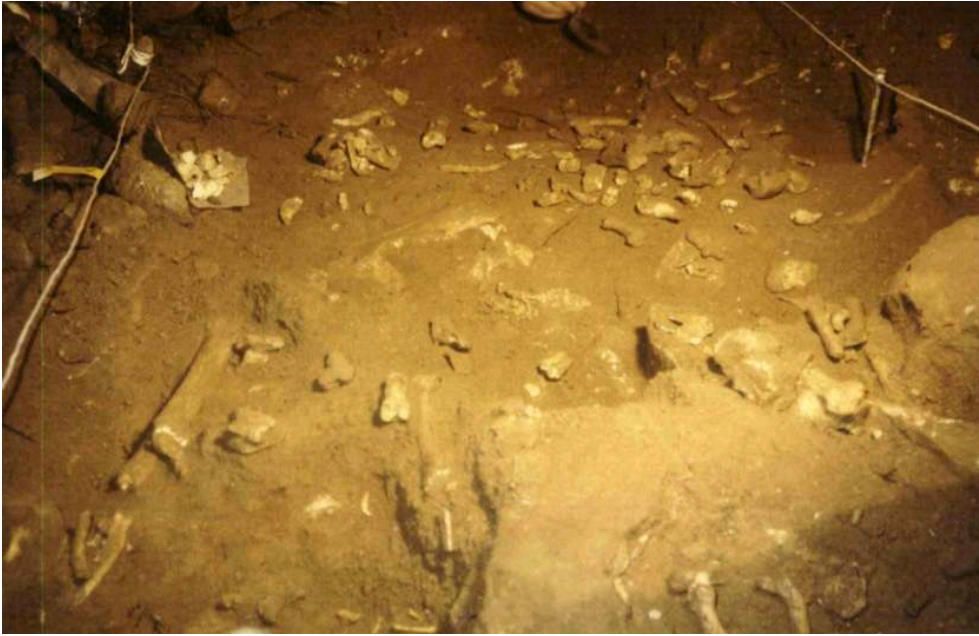
Fig. 3 – Premier niveau paléontologique mis au jour sous le plancher stalagmitique