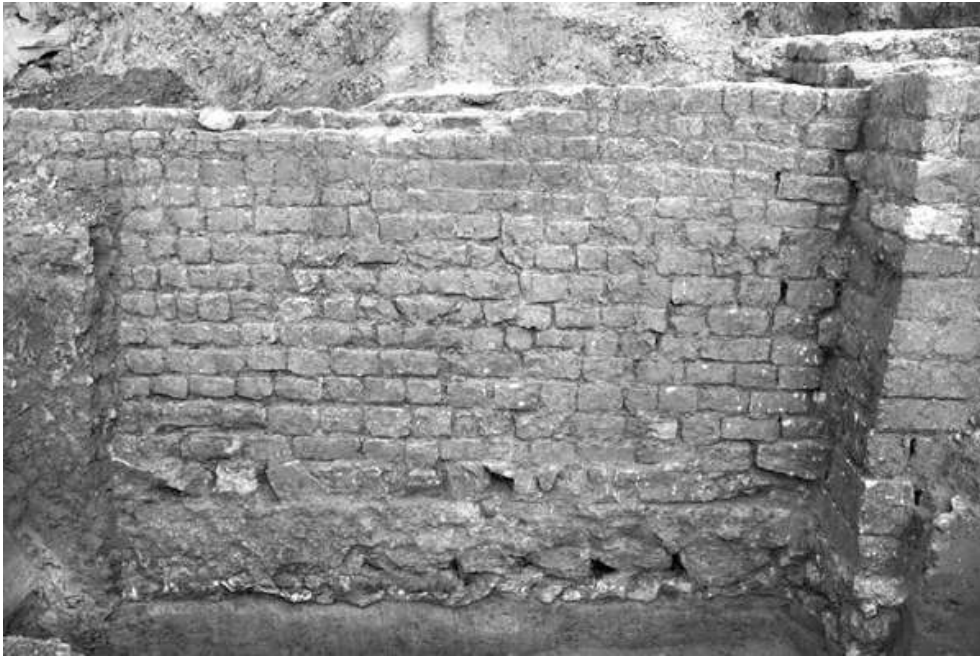
Fig. n°3 : Vue du mur 2

Auteur(s) : Portalier, Nicolas. Crédits : ADLFI (2007)