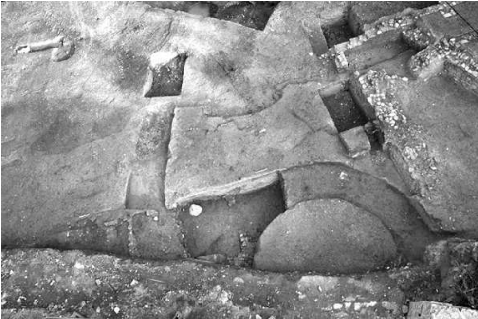
Fig. n°1 : Vue depuis le sud de la tranchée d'épierrement de la courtine et de la tour

Auteur(s) : Navarro, Thomas. Crédits : ADLFI (2007)