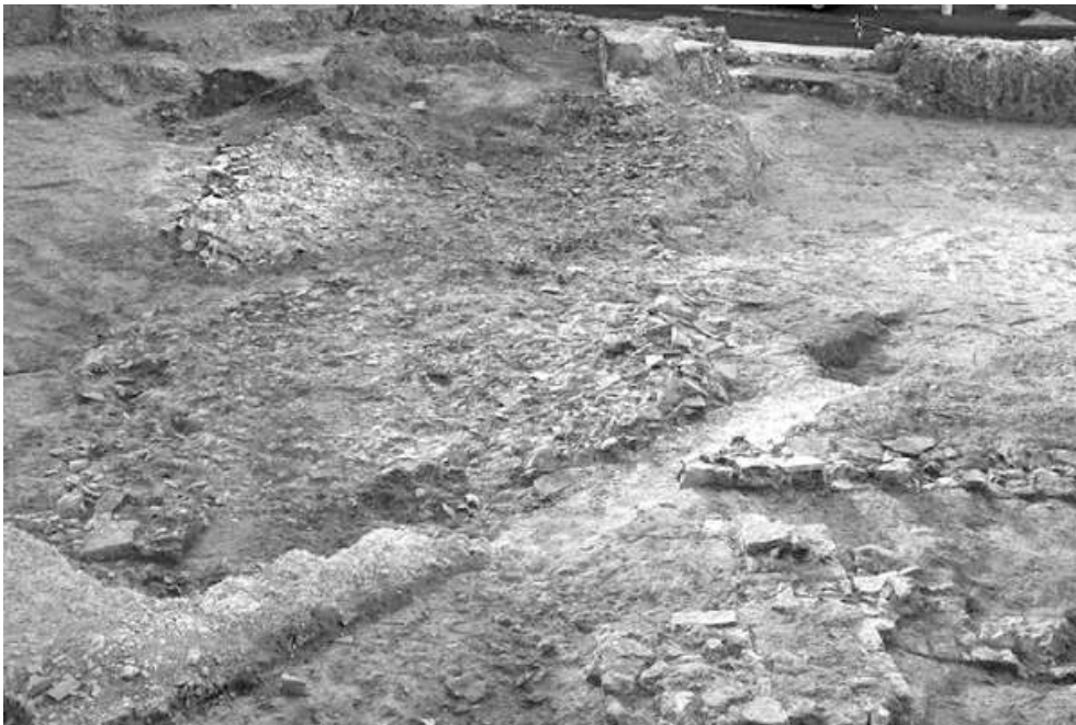
Fig. n°4 : Vue du nord de la voie en tuiles 101

Auteur(s) : Portalier, Nicoles. Crédits : ADLFI (2007)