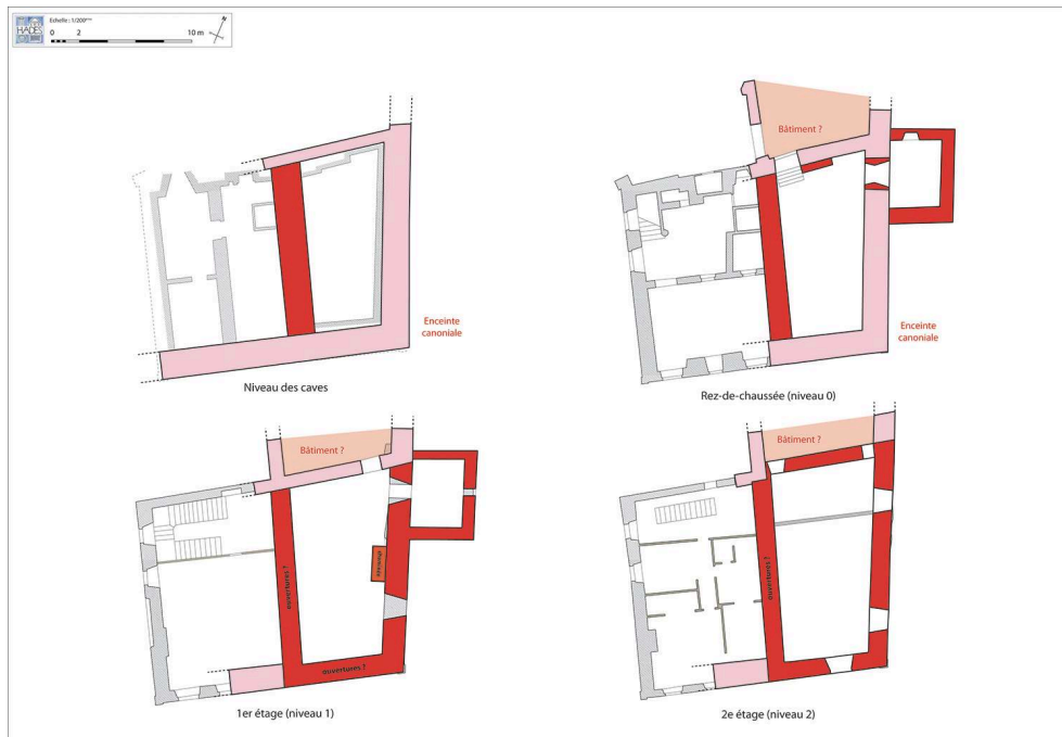
Fig. 2 – État 2