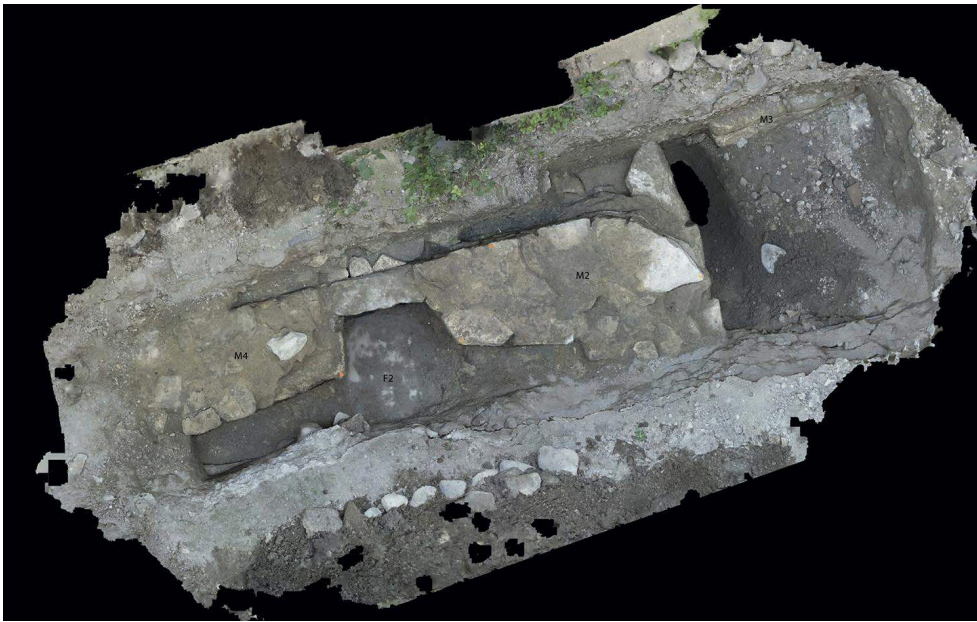
Fig. 3 – Montage photogrammétrique du système de canalisations