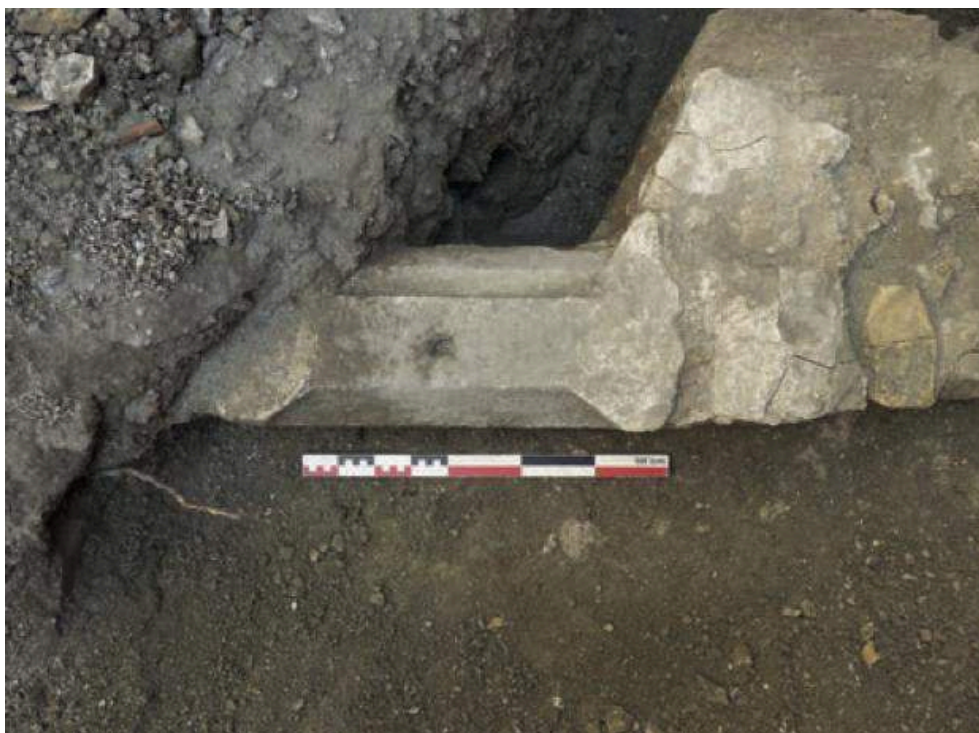
Fig. 2 – Pierre d'appui chanfreinée de l'ouverture du soupirail