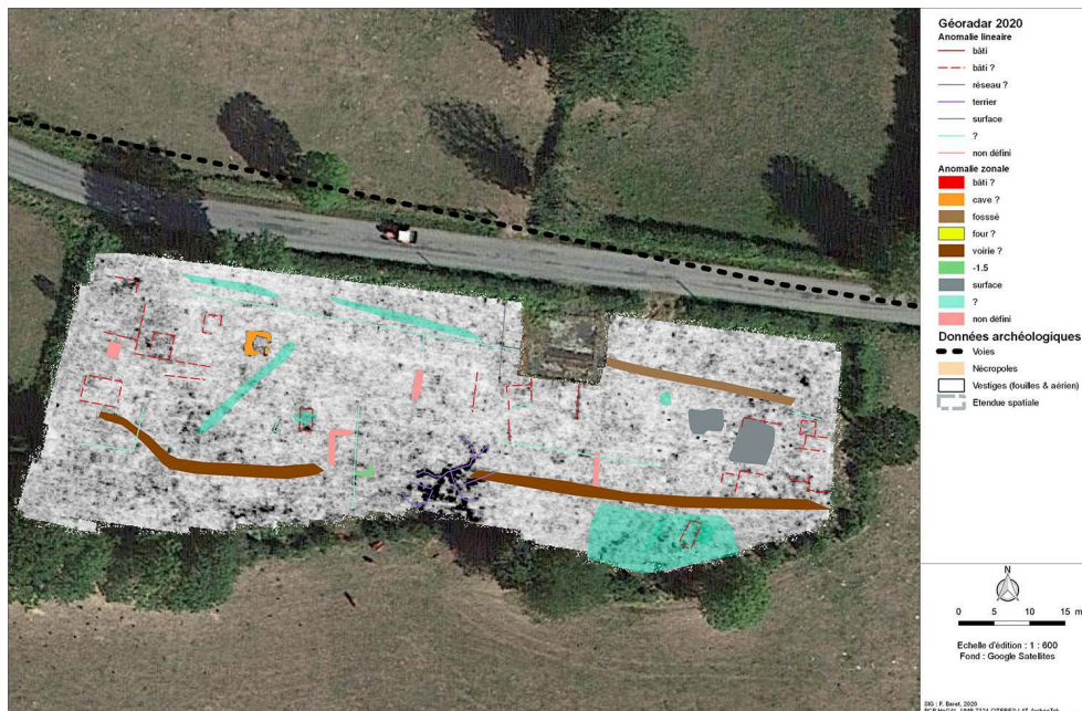
Fig. 1 – Plan général des anomalies de la parcelle 0C 0121