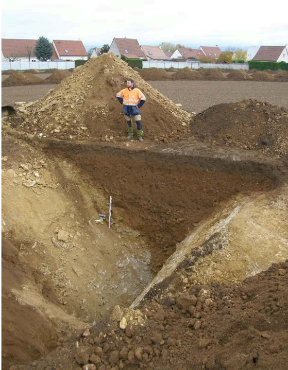
Fig. 1 – Le grand fossé bordant la voie antique