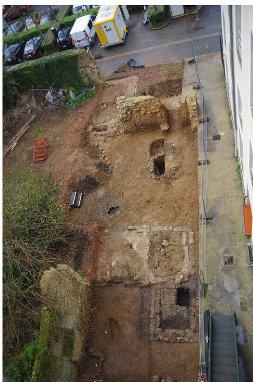
Fig. 1 – Vue d'ensemble de la zone de fouille