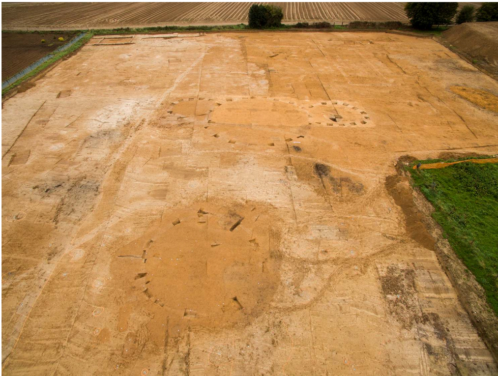
Fig. 1 – Les enclos pré-protohistoriques en cours de fouille, vus vers l'est