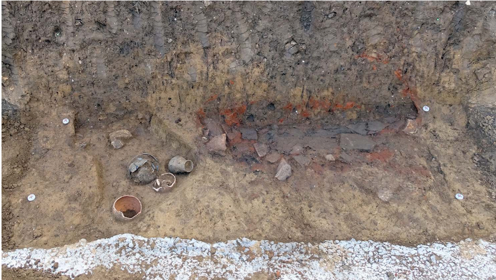
Fig. 2 – Four domestique (à droite) et possible dépôt funéraire (à gauche)