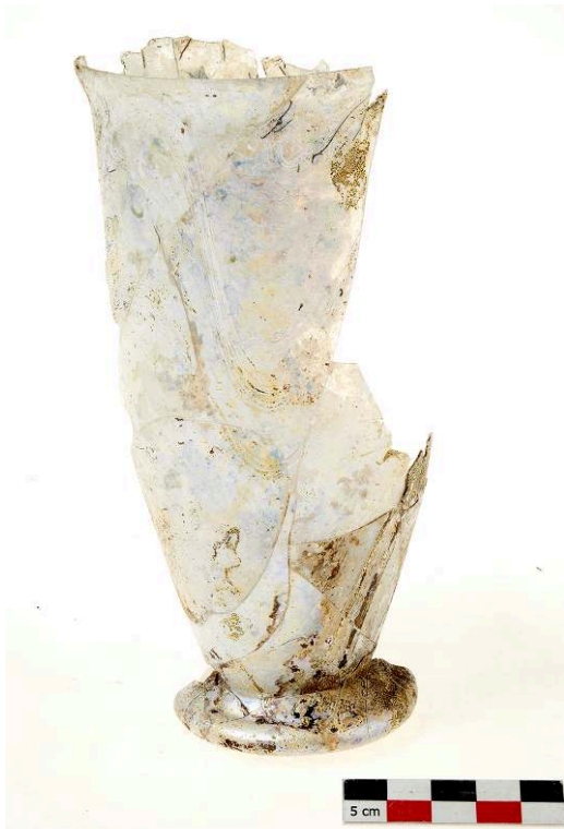
Fig. 3 – Le gobelet en verre accompagnant le possible dépôt funéraire