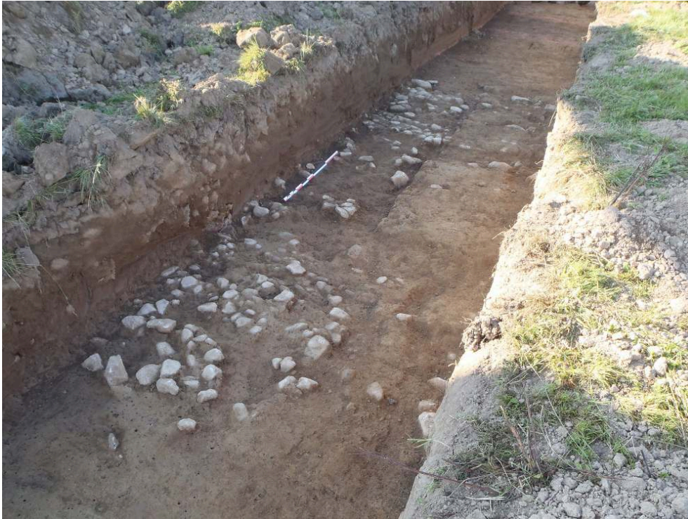
Fig. 2 – L’empierrement de la voie partiellement nettoyé dans la tranchée 27, vue vers le sud-est