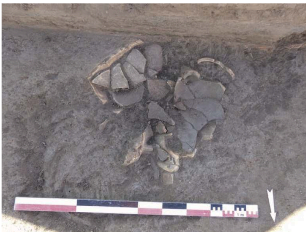
Fig. 2 – Vue de la concentration de céramiques et d’amphores du fossé F401