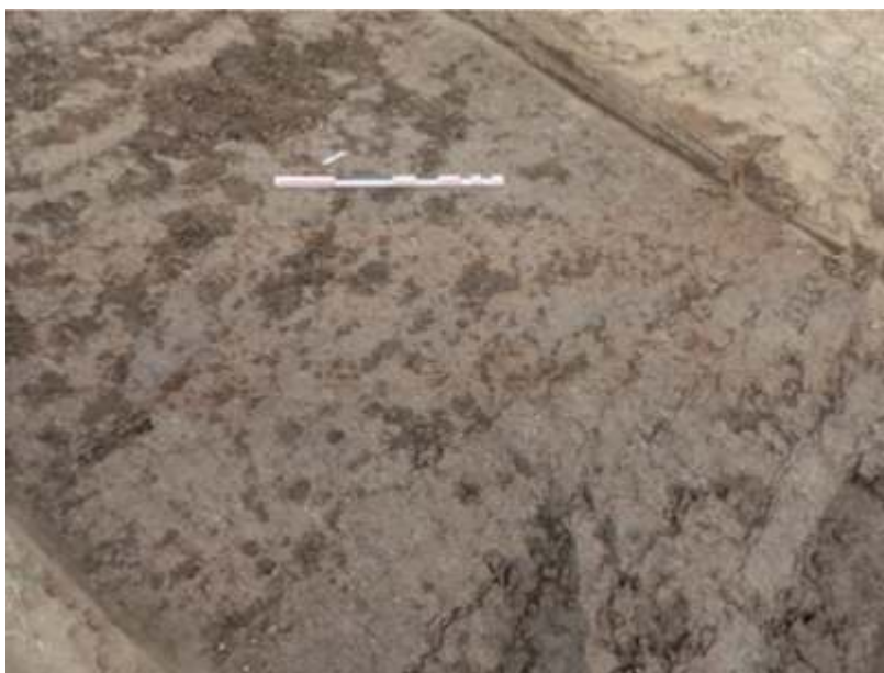
Fig. 1 – Vue du fossé F401