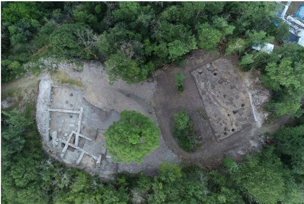
Fig. 1 – Vue aérienne des secteurs 9 (à gauche) et 8 (à droite)