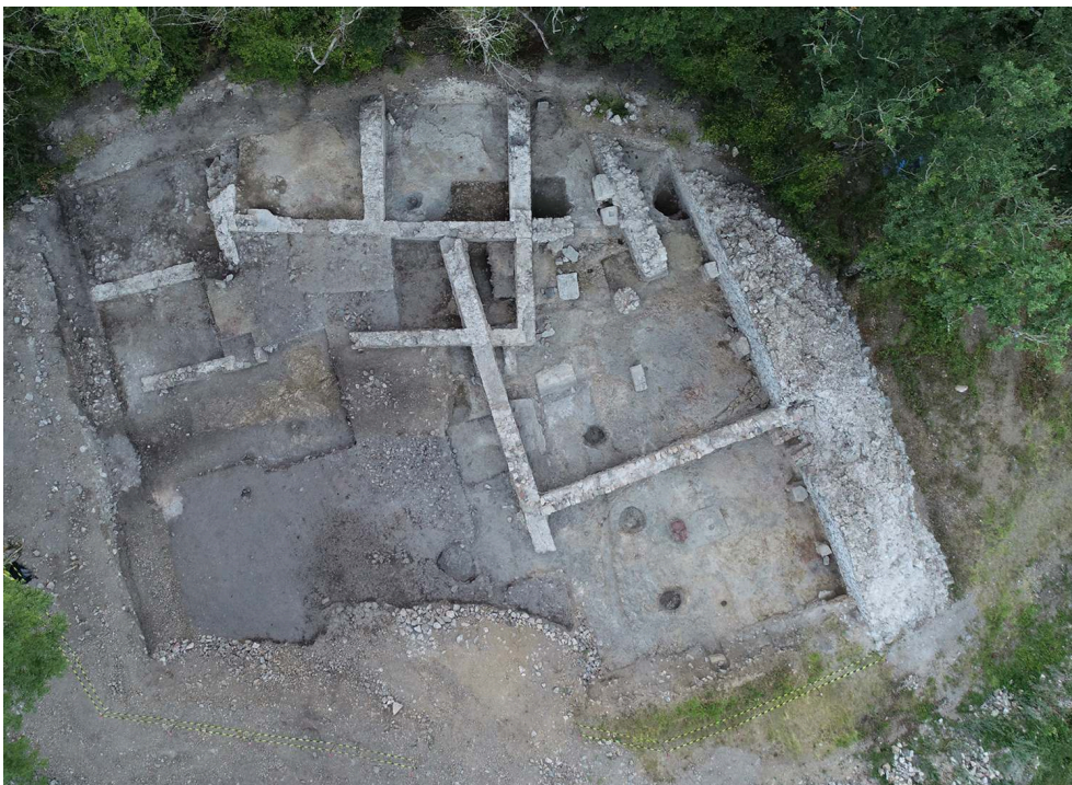
Fig. 3 – Vue zénithale du secteur 9