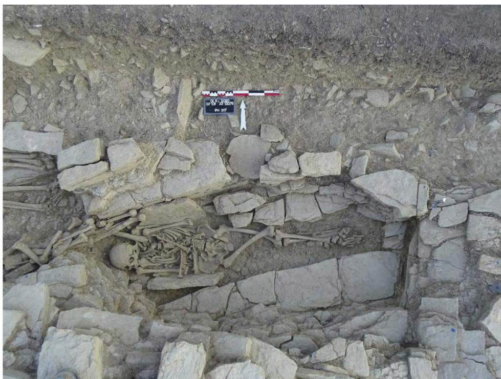
Fig. 2 – Vue de la sépulture SP 20359, sondage 20C