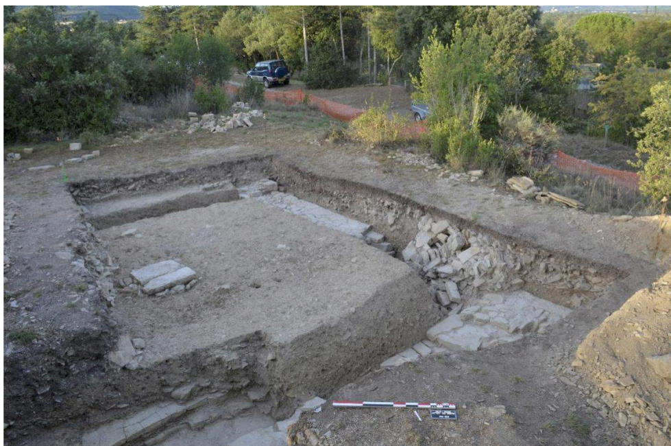
Fig. 3 – Vue générale du niveau de circulation SL 40404, SL 40415