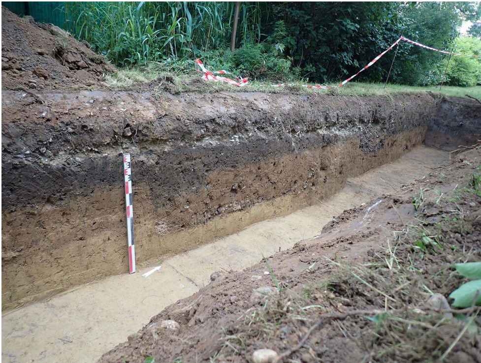
Fig. 3 – Vue en coupe de la tranchée de récupération de l'aqueduc de la Brevenne