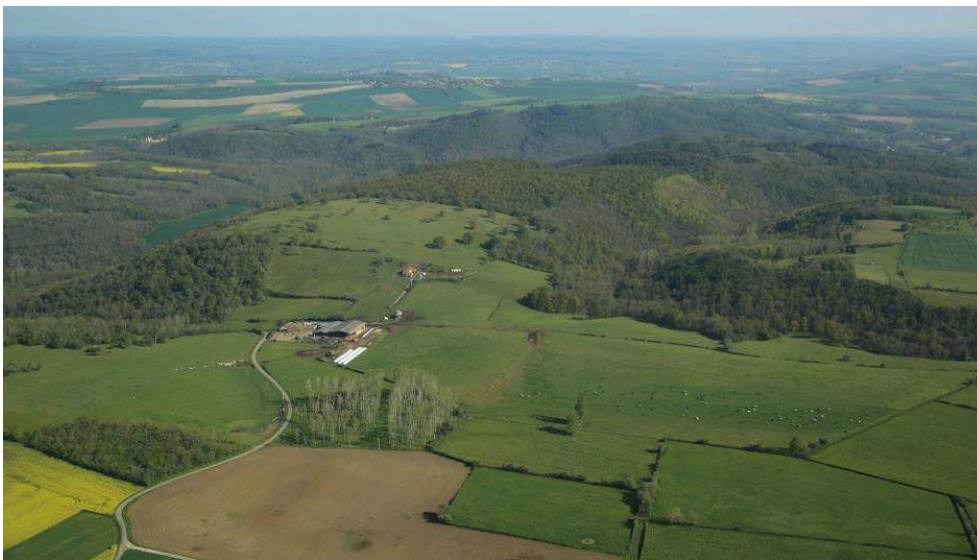
Fig. 2 – Vue aérienne du plateau de Mazerier (Allier)