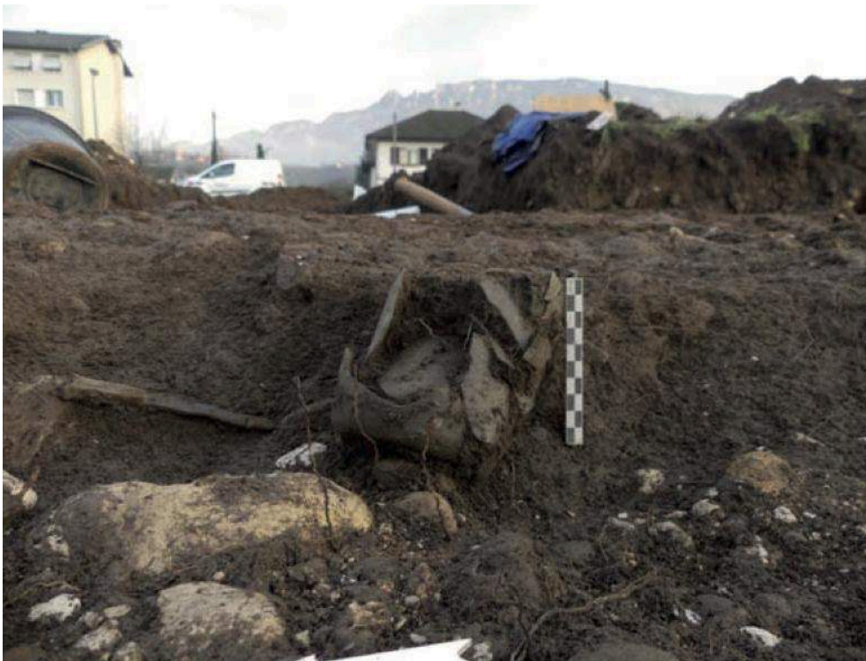
Fig. 1 – Détail des dépôts de la fosse F6 contre la paroi est