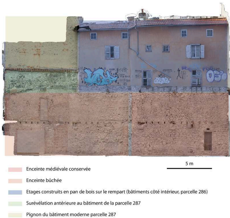
Fig. 3 – Ensemble de la « façade » : localisation des principales phases

Orthophotographie et DAO : équipe de fouille (Inrap).