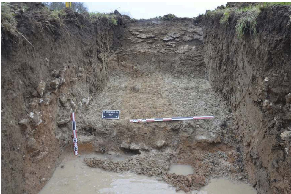
Fig. 2 – Fossé F2 dans le sondage 2