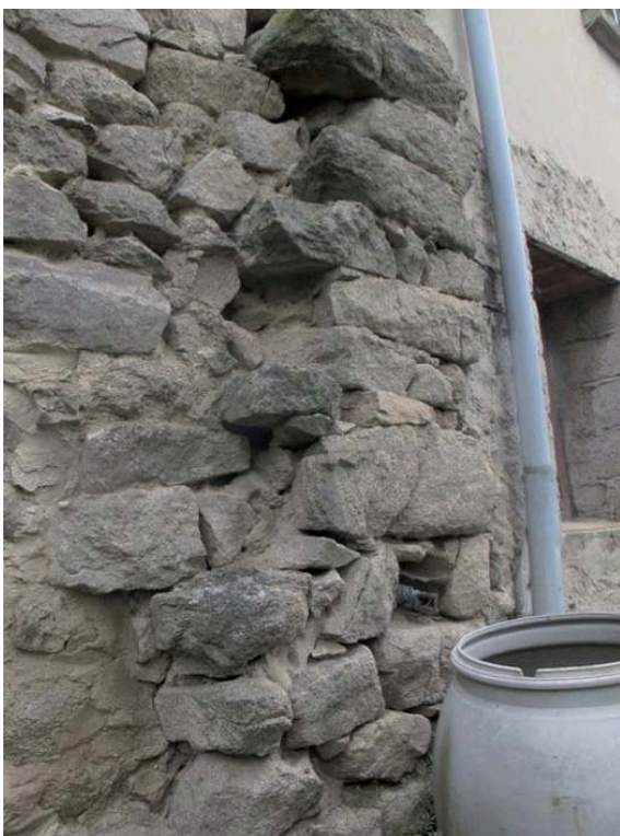
Fig. 3 – Arrachement du mur pignon occidental