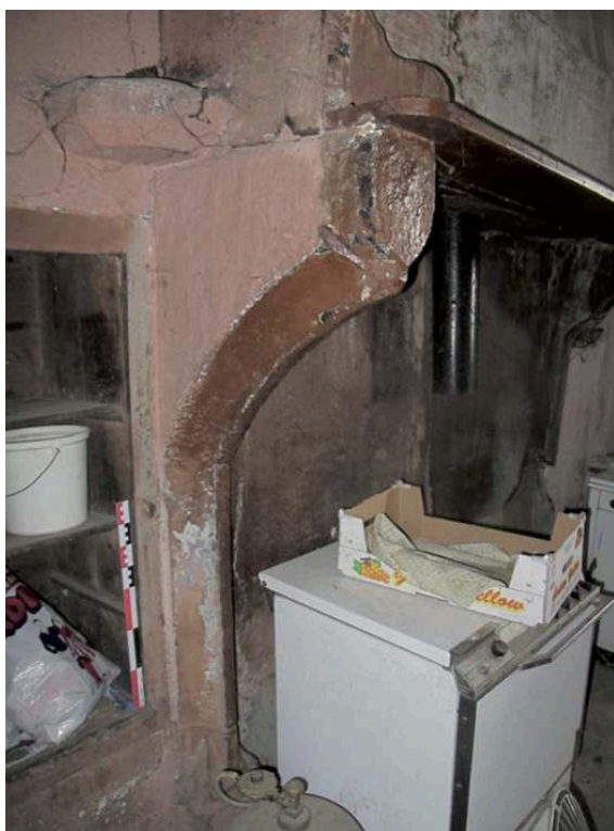
Fig. 2 – Piédroit de cheminée adossée contre le mur sud, au rez-de-chaussée