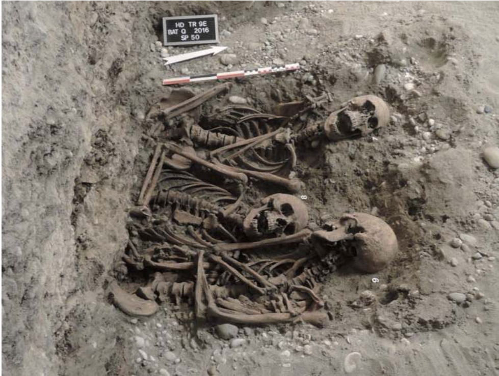
Fig. 3 – Sépulture 50 : individus 7 à 9