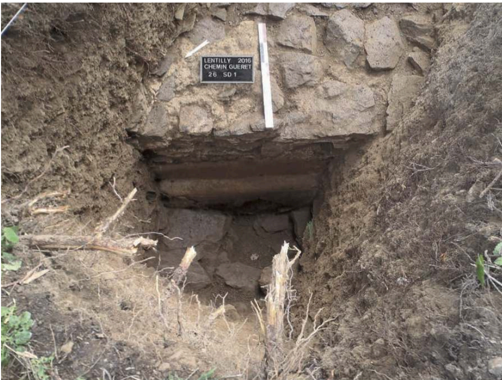
Fig. 3 – Coffrage latéral droit endommagé à une date indéterminée, antique ou post-antique