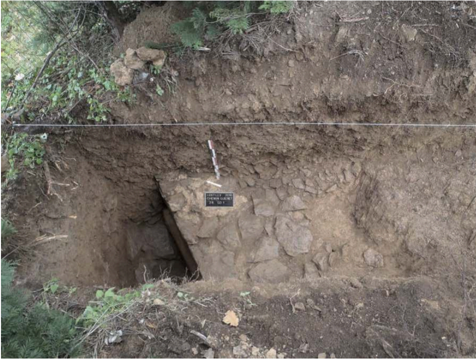
Fig. 2 – Fond du sondage avec l'apparition de l'aqueduc au niveau du surcreusement du rocher