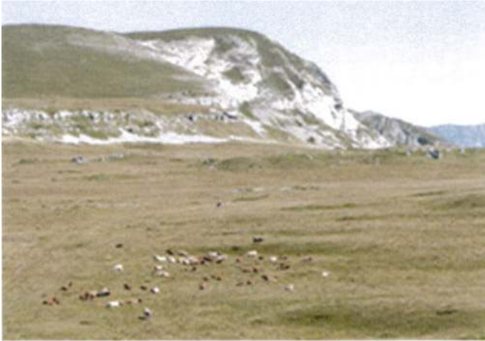
Fig. 1 – Bovins sur l'alpage de Font d'Urle

en lien, à un moment ou un autre, avec cette région (Michaud, Charpenel, Richaud, Moure, Maurel). Certains (Brun, Charpenel) gardent plusieurs années de suite à Font d'Urle. Comme trois autres bergers de Peyre Rouge, Charpenel vient des Alpes-de-Haute-Provence, de Larche, exactement, à la frontière Italienne. On retrouve bien les classiques deux pôles d'origine des bergers : montagne et Provence.