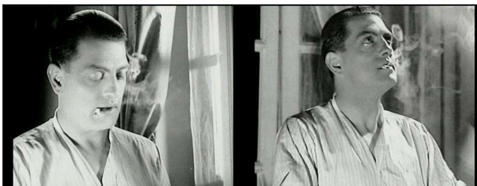
Figura 3: miradas contrapuestas al principio de Un Chien andalou