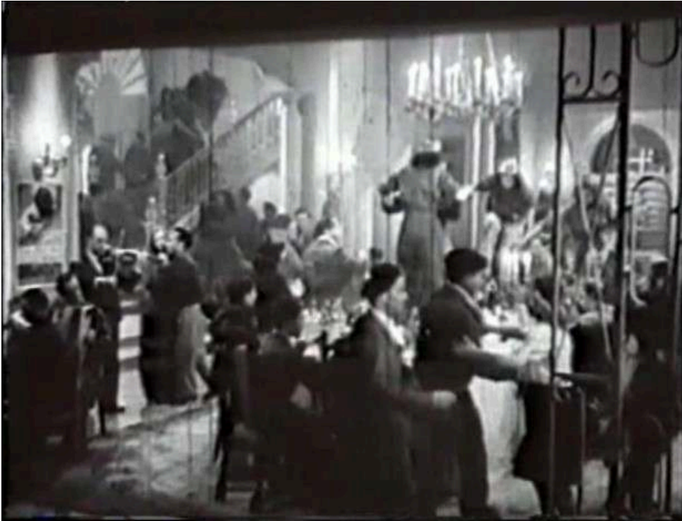
Séquence de la fête républicaine dans un hôtel particulier. Boda en el infierno ( Figs. 1 et 2)