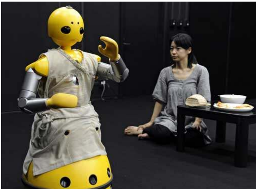
Osaka University et Eager Co. Ltd.

Hataraku Watashi (Moi, travailleur) de et mis en scène par Oriza Hirata