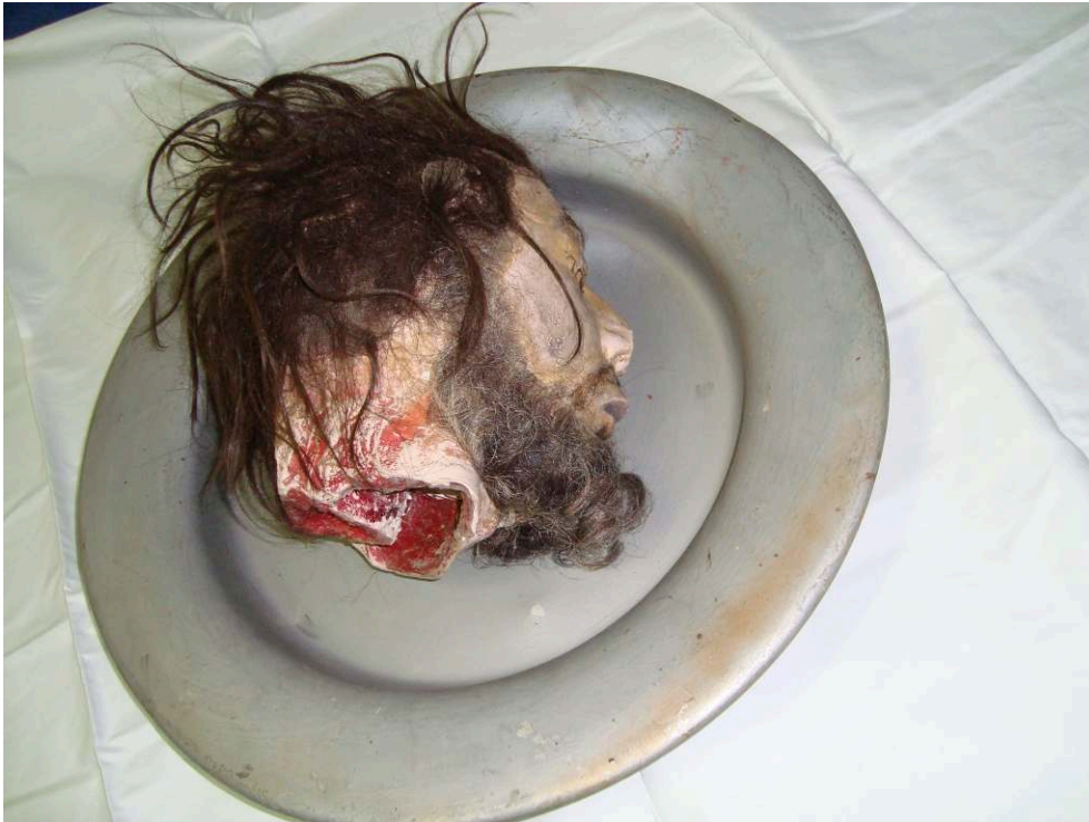
Figure 2 : La tête de Jokanaan