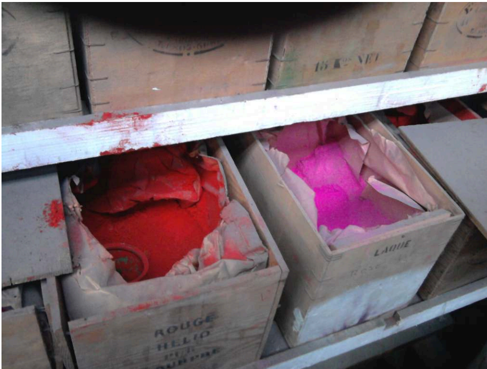
Figure 1 : Pigments