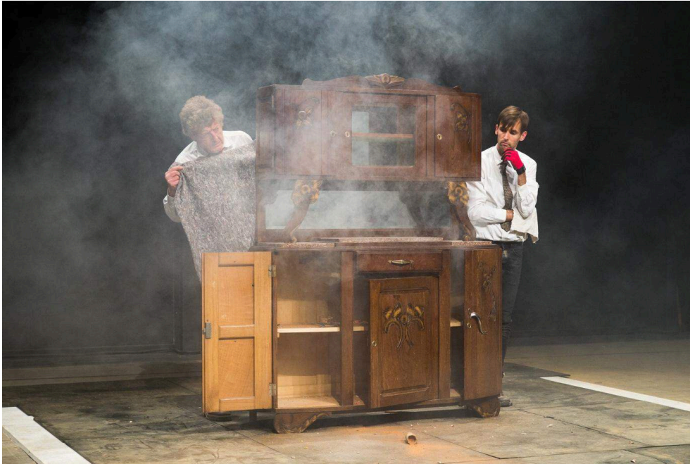
Buffet à vif