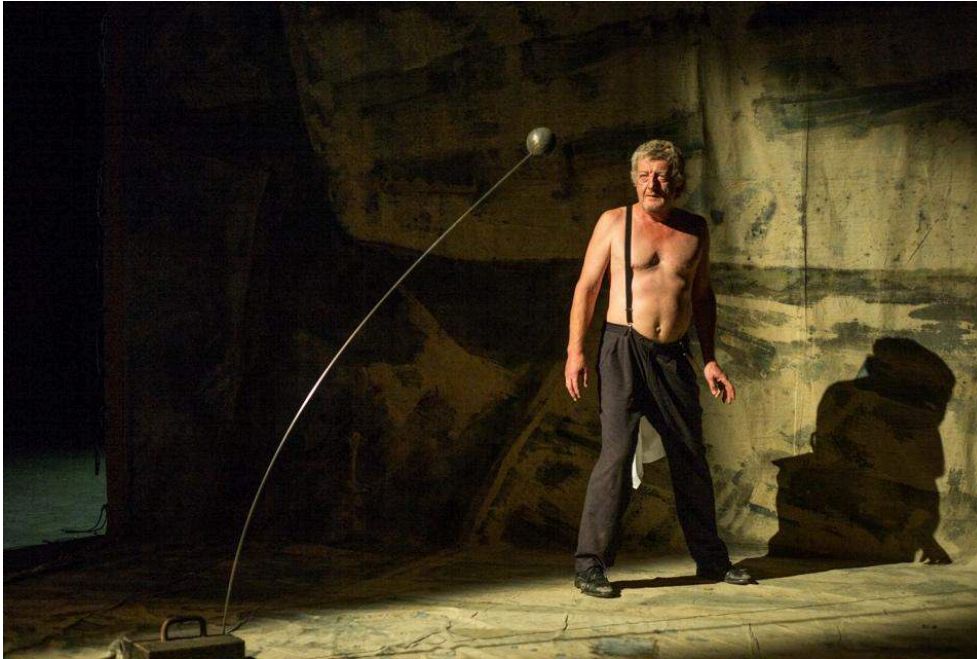
L'homme de plein vent