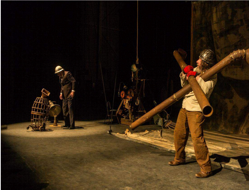
L'homme de plein vent