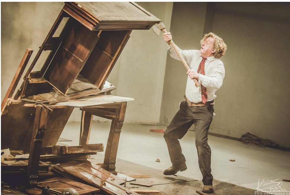
Buffet à vif