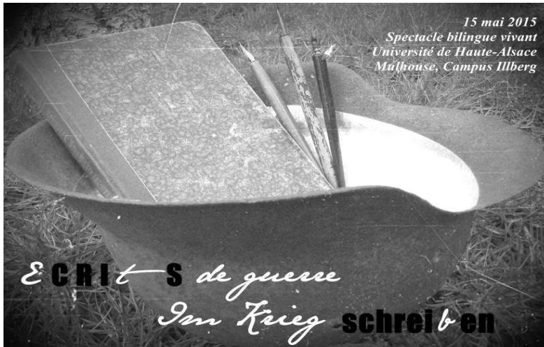
Illustration 2: Selbstentwerfener Flyer der Studierenden der Licence 1 allemand 2014-15 für den 15. Mai (Es handelt sich um einen Kriegshelm aus dem Privatbesitz einer Studierenden, deren Großvater im Stellungskrieg im Einsatz war.)

Ziel des Kooperationsprojektes war es, diese Zeitdokumente auf unterschiedlichste Weise zum Sprechen zu bringen, d.h. ihnen Stimme zu verleihen, sie facettenreich zu vertonen und anschließend aufzuführen. Ein mehrsprachiges Lehrerkollektiv, das sich aus Muttersprachlern unterschiedlicher Varietäten des Deutschen (Österreichisches Deutsch, Elsässisch und Norddeutsch bzw. „hochdeutsche“ Standardlautung) sowie aus Germanisten französischen Ursprungs zusammensetzte, hat dabei die Lernenden im Alter von 14 bis etwa 24 Jahren allwöchentlich betreut. Das Sprachniveau der Schüler erstreckte sich vom gelegentlichen B1-Sprecher bis hin zum komplexere Strukturen beherrschenden C2-Sprecher. Außerdem gab es einige