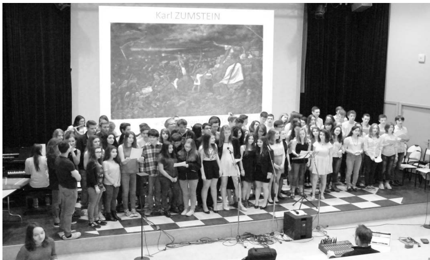
Illustration 3: Endszene der Veranstaltung am 15. Mai 2015 im Amphi Weiss, UHA/Illberg

Dabei spielte der Aufführungsort selbstverständlich eine wichtige Rolle: Wir hatten einen Hörsaal ausgewählt, der über eine kleine Bühne verfügt. Wissenschaft, Kunst und Pädagogik waren auf diese Weise gleichsam vertreten. Ferner evoziert die Aufführungssituation den Ausgangspunkt von Theodor Siebs: Ein Wissenschaftler nimmt an einer künstlerischen Darbietung teil, um daraus einen pädagogischen Gewinn zu ziehen... offen bleibt dabei, ob der Linguist tatsächlich Freude an der Aussprache des Deutschen als Fremdsprache in seiner Dialekt- und Aussprachevielfalt auf der improvisierten Bühne der oberrheinischen Universität gehabt hätte.