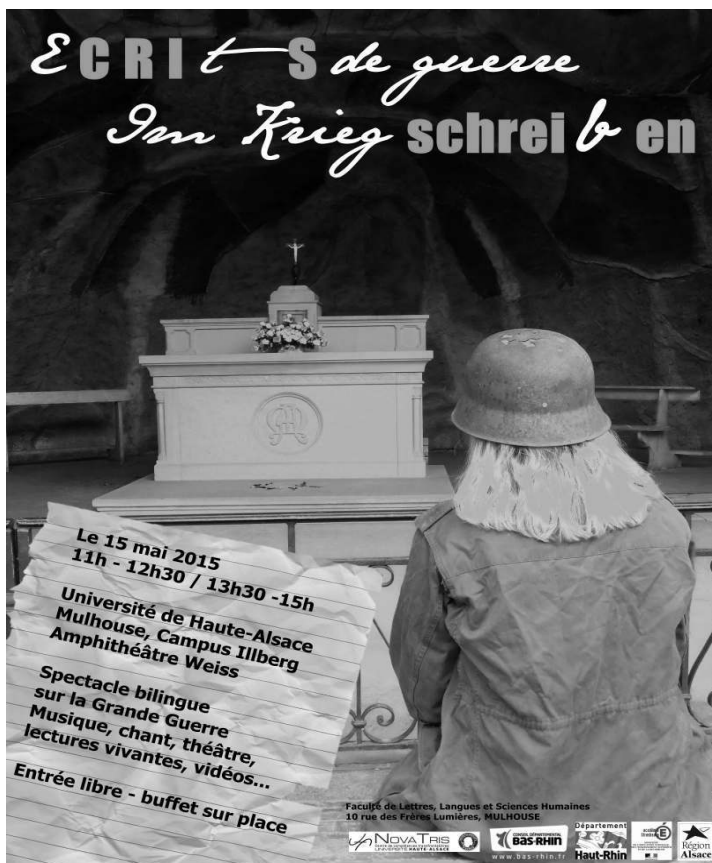
Illustration 4: Plakat der Schüler und Studierenden

(É)cri(t)s de guerre → Cris de guerre Im Krieg schrei(b)en → Im Krieg schreien