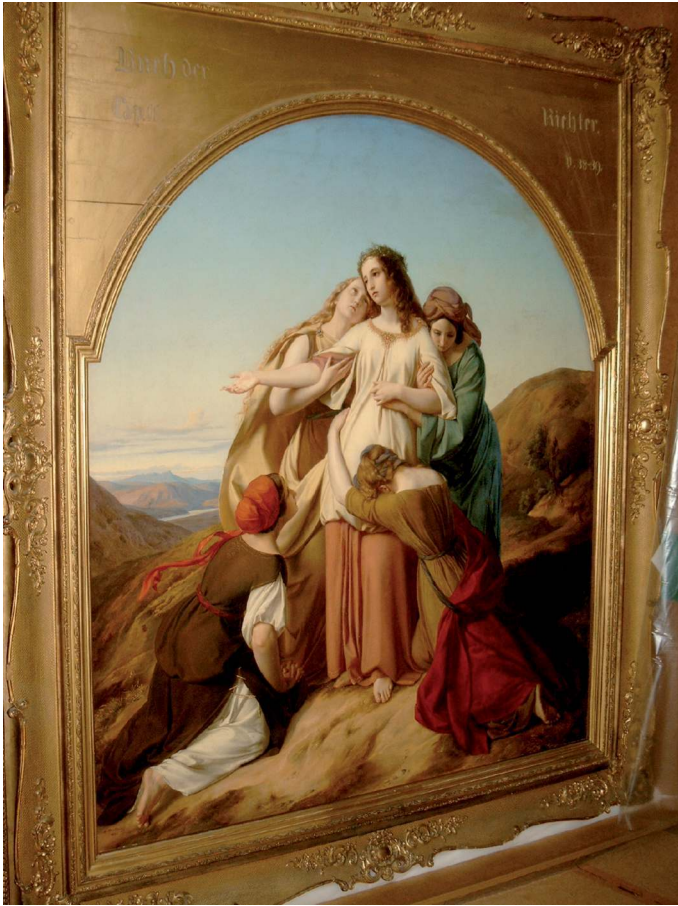
Oesterley, Carl Wilhelm Friedrich (Göttingen, 1805-Hanovre, 1891) La Fille de Jephthé , 1835

Huile sur toile 131,2 x 116,8 cm, Niedersächsisches Landesmuseum Hannover