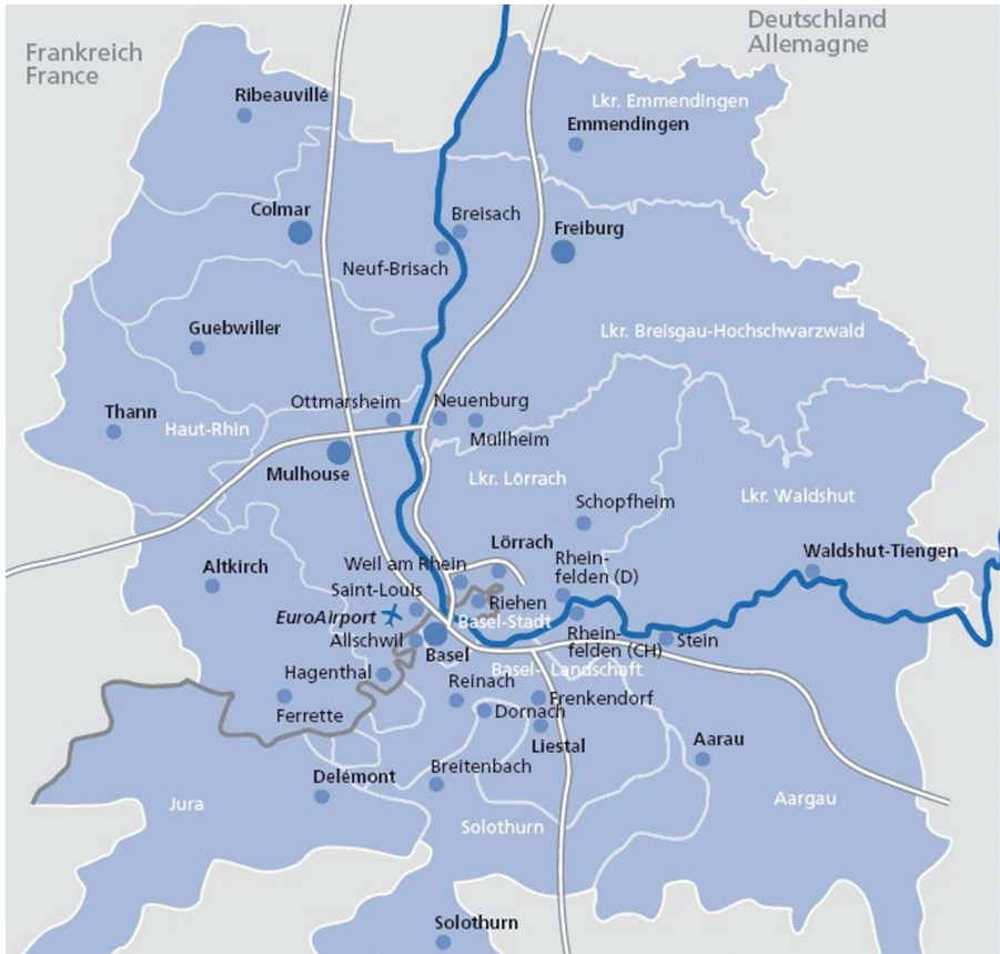
La « Regio TriRhena

oberrheinischen Komponisten, das populäre [Volks]Liedgut diesseits und jenseits des Rheins fallen ebenso darunter wie die zahlreichen Tonbänder und Kassetten von Radio Verte Fessenheim, heute Radio „Dreieckland“, mit seinem bundesweit beachteten Kampf gegen die Atomkraft. Über ein Internetportal sollen diese Dokumente einer breiten Öffentlichkeit zugänglich gemacht und gleichzeitig als digitaler Mikrofilm Langzeit gesichert werden.