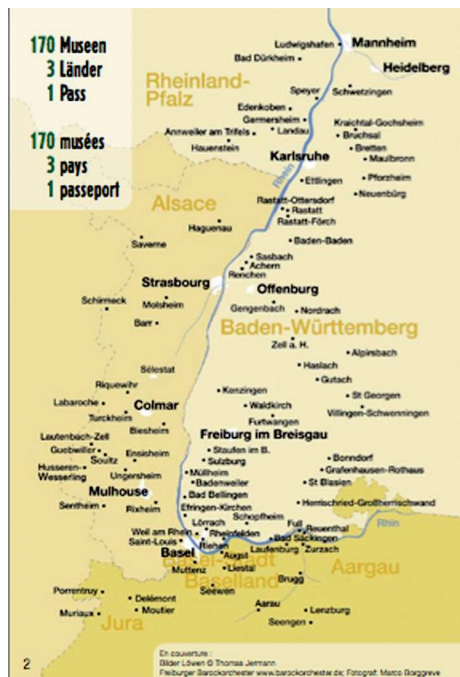
Une seule carte d'entrée pour 170 musées du Rhin supérieur (2007)

Neben vielen utopischen Visionen formulierte der Kongress auch eine Reihe konkreter Projekte, die in den Folgejahren umgesetzt werden konnten. So befasste sich seit 1993 ein Expertenausschuss der Oberrheinkonferenz mit der Förderung des Austausches von Theater- und Tanzprogrammen am Oberrhein bei Gastspielen und Festivals, ein weiterer Ausschuss „Biblio3“ initiiert Bibliothekspartnerschaften, fördert die Vernetzung der öffentlichen Bibliotheken am Oberrhein und die gemeinsame Fortbildung des Bibliothekspersonals. Wesentlich erleichtert wurde und wird die Umsetzung dieser Projekte durch die Interreg-Initiative der Europäischen Kommission, die seit dem Jahre 1991 mit bedeutenden Mitteln grenzüberschreitende regionale Aktivitäten auch im kulturellen Bereich mit bis zu 50% der Gesamtkosten unterstützt 6 . Als Folge der ersten grenzüberschreitenden Symposien der Jahre 1985 bis 1987, die sich mit dem Thema „Universitäten und Regionen“ befasst hatten, war zeitgleich zum Colmarer Kulturkongress ein grenzüberschreitender Zweckverband der oberrheinischen Universitäten gegründet worden. Die Albert-Ludwigs-Universität Freiburg im Breisgau, die Universität Basel, die Universitäten Louis Pasteur, Marc Bloch und Robert Schuman in Straßburg, die Universität Karlsruhe und die Universität de Haute Alsace in Mülhausen vereinbarten in der Europäischen Konföderation der Oberrheinischen Universitäten (EUCOR) eine engere Zusammenarbeit in allen Bereichen von Lehre und Forschung durch den Austausch