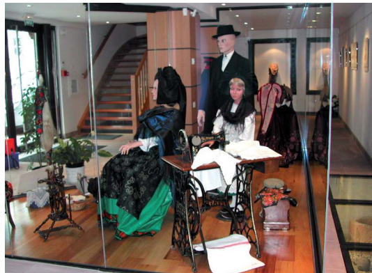
De l'urne funéraire à la Maison du Kochersberg.