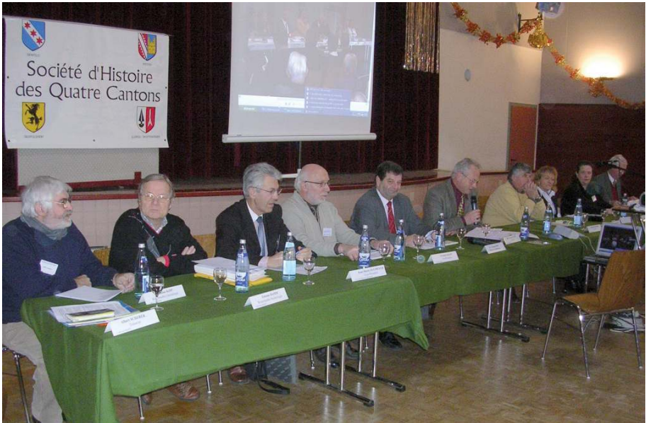
Assemblée générale de la Société à Nordhouse en 2006.