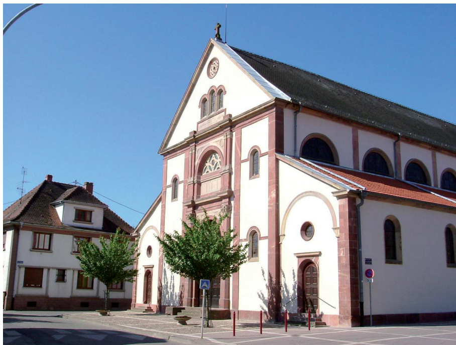
Un patrimoine préservé : église de Huttenheim, façade de 1843.