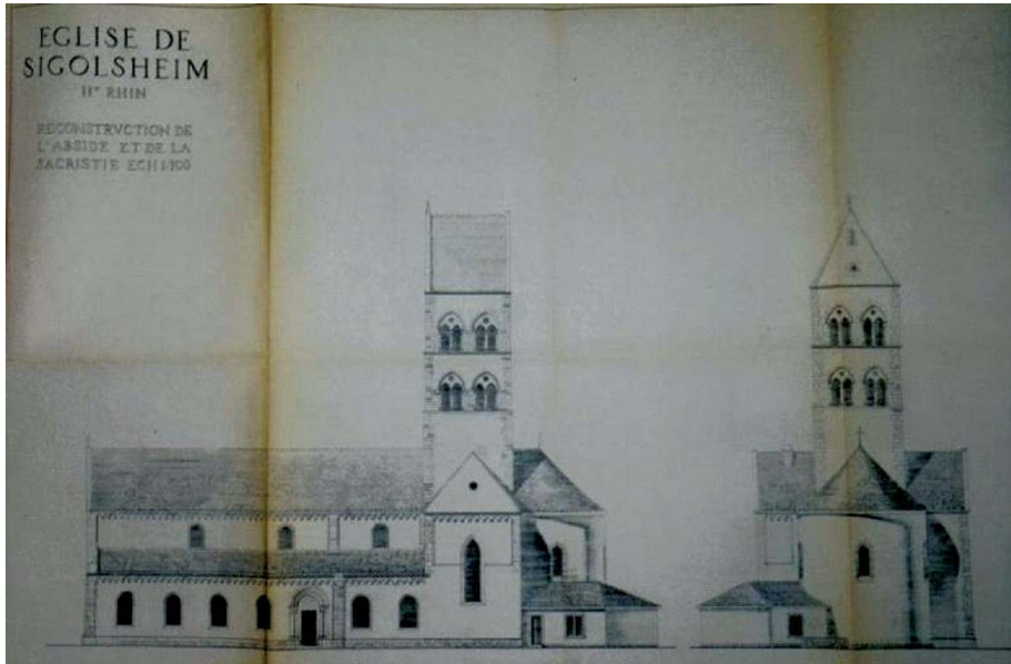
C.-G. Stoskopf, architecte : élévation de la nouvelle église de Sigolsheim (A.P. Stoskopf ADHR)

et au sort des « Malgré Nous », et à la reconstruction du village, a été renouvelée en 1995 pour le 50 e anniversaire. Cette année-là, la Société d'Histoire enregistra et diffusa les témoignages des habitants et organisa un colloque entre anciens combattants français, américains et allemands de la bataille de Sigolsheim. En juin 2005, 60 e anniversaire, l'exposition la plus riche fut présentée particulièrement aux anciens de Rhin et Danube qui tenaient à Colmar leur dernier congrès national avant dissolution.