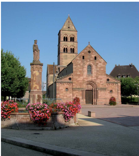
L'église actuelle.