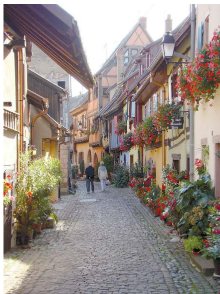
Maisons à colombages du XVIe et XVIIe siècle, construites entre les deux murs d'enceintes de la ville d'Eguisheim.

La société d'histoire s'engage à contribuer pleinement à la réussite de la commémoration de la naissance du pape