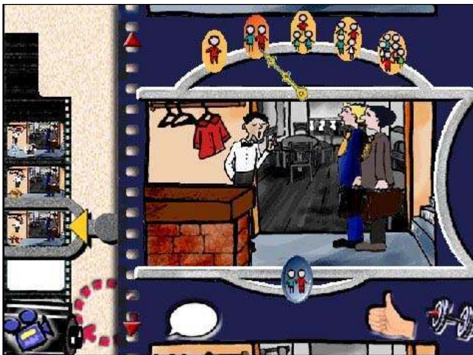
Figure 3 : La métaphore de la représentation cinématographique dans LIT .

En matière de conception des interfaces, les travaux menés ces dix dernières années montrent clairement l'intérêt de recourir à une ou plusieurs métaphores pour structurer le design des possibilités dialogiques offertes au sein d'un environnement d'apprentissage multimédia. Dans certains cas, la métaphore sera choisie assez librement en fonction d'une ambiance que l'on souhaite recréer, d'un clin d'œil que l'on veut adresser, d'une analogie que l'on veut mobiliser pour faciliter la mise en oeuvre de certaines fonctionnalités offertes par le logiciel. Dans d'autres circonstances, la métaphore s'imposera d'elle-même en fonction des compétences à installer chez l'apprenant et du contexte dans lequel ces compétences seront mises en oeuvre. Ainsi, par exemple, le choix de la métaphore de la représentation cinématographique ( figure 3) pour aider à visualiser le déroulement temporel d'une situation dans l'environnement d'apprentissage LIT , tout en cadrant assez bien avec l'ambiance générale du logiciel, offre une analogie fonctionnelle intéressante à exploiter par rapport à l'idée que chacun se fait de l'enregistrement puis du visionnement d'une séquence filmée. Dans ZincCast , c'est l'analyse des tâches qui nous a amenés à définir chacune des interfaces par analogie avec les activités que l'apprenant aura à prendre en charge en contexte réel.