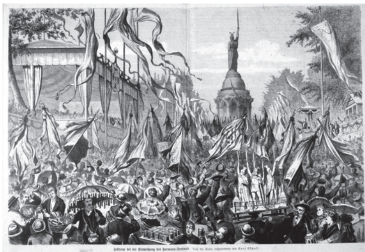
Fig. 2. L'érection de la statue d'Hermann (Dessin de K. Ekwall paru dans Die Gartenlaube, Illustriertes Familienblatt , 1875. D'après H. Buck, « Der Literarische Arminius-Inszenierungen einer sagenhaften Gestalt », dans W. Schlüter (éd.), Kalkriese - Römer im Osnabrücker Land. Archäologische Forschungen zur Varusschlacht , catalogue d'exposition, 1993, p. 280.)

Il y aurait ainsi toute une manière nouvelle pour nous de considérer l'histoire de la Germanie et les noms héroïques invoqués comme un patrimoine exclusif par la littérature allemande. Il n'y a pas jusqu'au poème épique des Niebelungen qui ne soit faussement revendiqué par les Allemands et qui ne puisse tout aussi bien être regardé comme la véritable épopée nationale des Francs 11 .