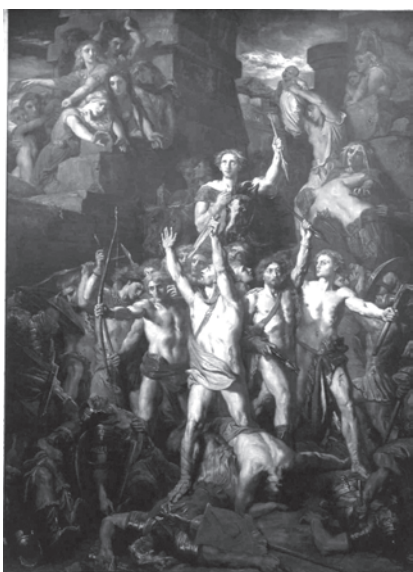
Fig. 1. La défense des Gaules (1855). tableau de Théodore Chassériau, collection du musée d'art Roger-Quillot, ville de Clermont-Ferrand

pays et dont Vercingétorix est le premier exemple 9 . Cette irruption des Gaulois dans la mémoire nationale se traduit par un nombre infini de productions littéraires (romans, poèmes, pièces, opéras), de libelles historiques, de représentations figurées plus ou moins fantaisistes dans les journaux, les arts mineurs, mais aussi la sculpture ou la grande peinture. Depuis les Trois Glorieuses, le Gaulois est à la mode. Contentons-nous, ici, de citer le tableau de Théodore Chassériau, au musée des Beaux-Arts de Clermont-Ferrand, La défense des Gaules , où l'on voit le fils de Certil, dans une quasi nudité héroïque, exhorter les Gaulois à la bataille, les bras et les yeux levés au ciel (fig. 1).