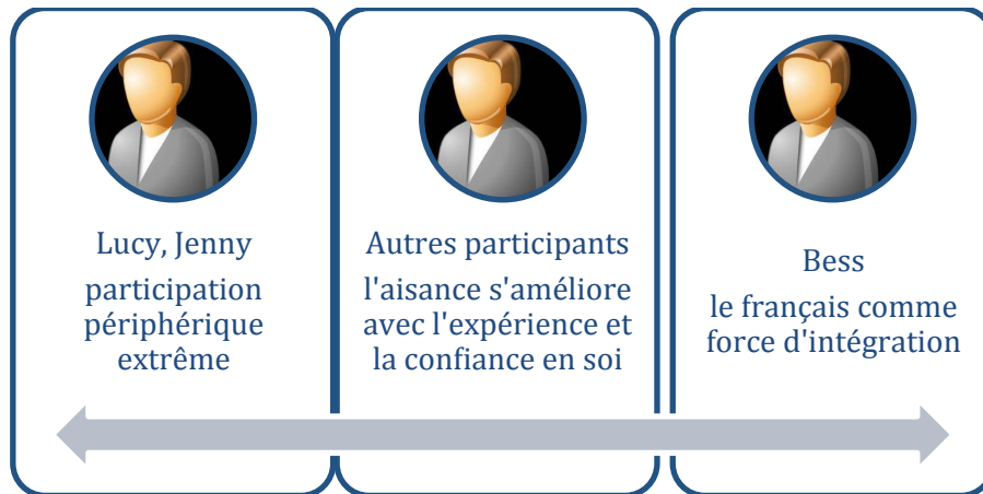
Schéma 2. Le français au travail

de leur maîtrise de la L2, au contraire, comme d'une véritable force d'intégration professionnelle (cf. schéma 2, le cas de Bess).