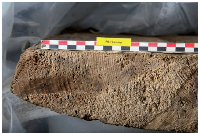
Fig. 3 : Section transversale d'un bois gorgé d'eau (sapin) rafraîchi à la lame de rasoir provenant de l'épave romaine Arles-Rhône 3.