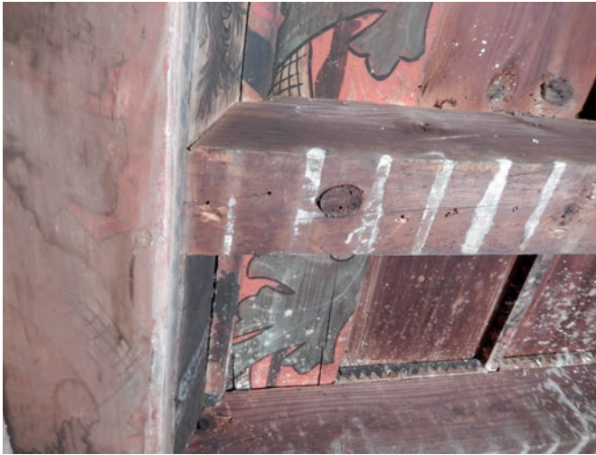
Fig. 5 : Cheville de blocage des ligatures des radeaux par lesquels les billes employées à la confection des solives du plafond peint de la Maison du Patrimoine (Lagrasse, Aude) ont été acheminées.

Les analyses dendrochronologiques menées plus au sud, en domaine méditerranéen, connurent un déroulement sensiblement différent. À leur début, aucune chronologie régionale ayant fonction de référence sur les derniers siècles n'étant disponible, les premières tentatives de datation recoururent aux référentiels développés dans d'autres régions qui, bien évidemment, ne furent d'aucune utilité car non représentatifs des régions dans lesquelles les arbres s'étaient développés. La construction de référentiels locaux, propres à la région méditerranéenne, fut donc amorcée.