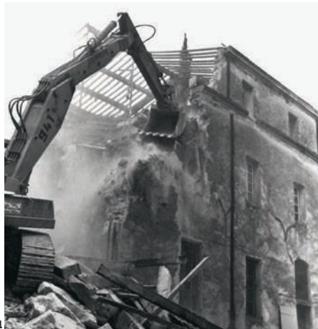
1. La destruction du couvent en 1977, après le départ des Archives départementales, la conservation des fonds nécessitant des bâtiments plus modernes.

La plaque s'ajoute à une série très restreinte de dépôts enfouis au moment de la fondation de plusieurs édifices montpellierains : l'église de l'Observance en 1605, la chapelle des Carmes du Palais en 1706, l'hôtel de Saint-Félix en 1751, le château de la Mosson, Notre-Dame-des-Tables... Autant de précieux documents sur l'histoire de Montpellier. La plaque des Récollets reste cependant la seule mise au jour dans son contexte archéologique. Elle montre la parfaite concordance entre les textes et les archives du sol.