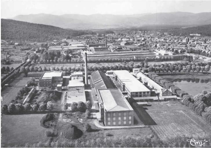
Fig. 1. – Vue aérienne du site

l'histoire et l'innovation sont en regard. Appréhender et promouvoir le patrimoine industriel comme un système sociotechnique à travers les dernières technologies numériques, telle est l'ambition de ce projet.