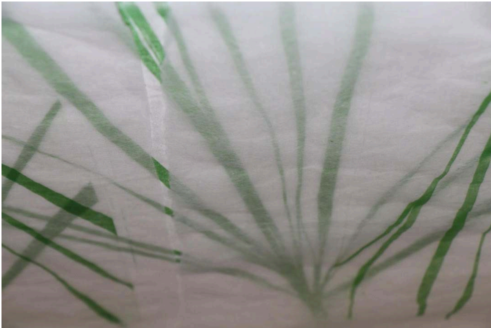
Julieta Hanono, El jardín mágico de Ruperta, 2018