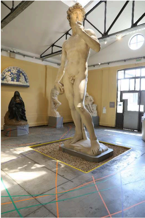
JULIETA HANONO, COSMOLOGÍA DE LAS POETAS, 2018 AL PRESENTE