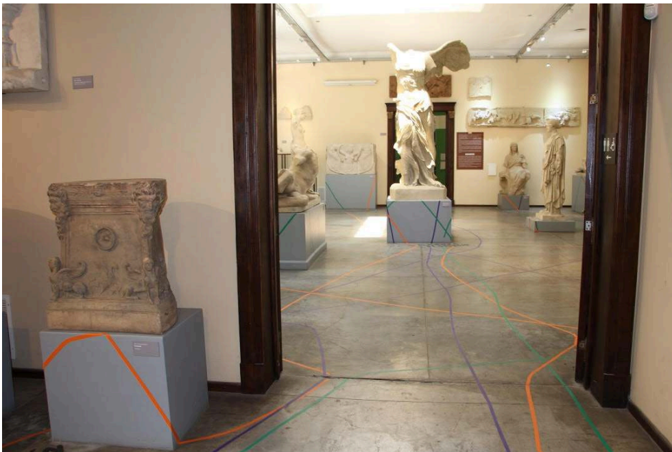
JULIETA HANONO, COSMOLOGÍA DE LAS POETAS, 2018 AL PRESENTE