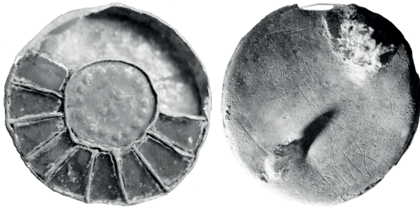
FIG. 1. — Fibule runique d'Enkering (Allemagne) recto et verso.